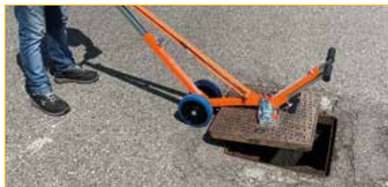
Utilizzo 1: sollevamento con gli alzachiusini magnetici CL9, CL10 o CL11.