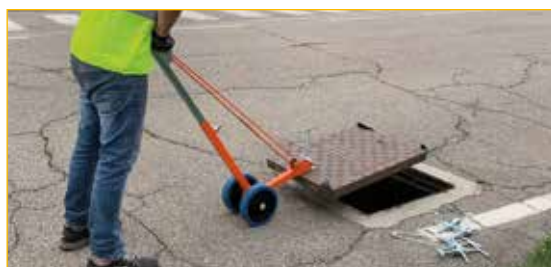
Utilizzo 3: in combinazione con set morsetti meccanici ad aletta e gancio.