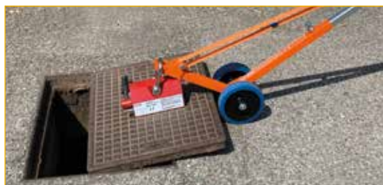
Utilizzo 2: in combinazione con magnete permanente (PM400 o PM500).